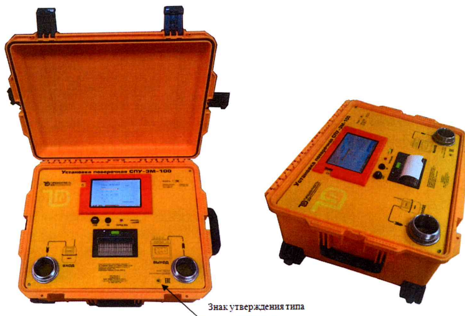
Рисунок 1- Общий вид установок поверочных СПУ-3М-100

Пломбирование установок поверочных СПУ-3М-100 и обозначение мест для нанесения поверительных клеев в целях предотвращения несанкционированной настройки и вмешательства осуществляется в соответствии со схемой на рисунке 2.